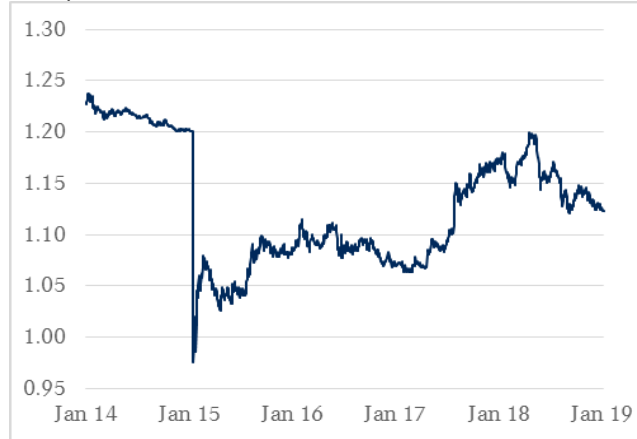
EUR / CHF