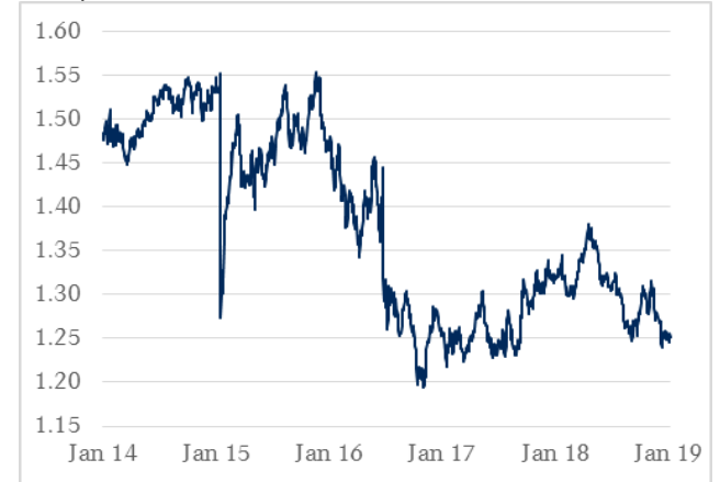
GBP / CHF