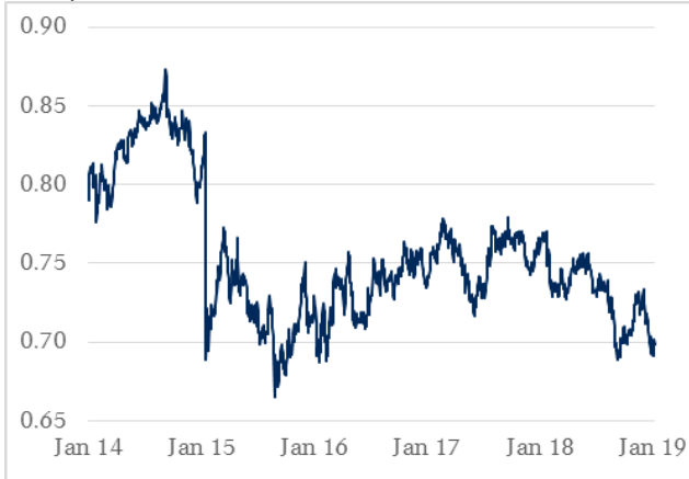
AUD / CHF